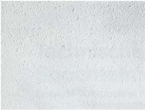
Готовое распыленное покрытие